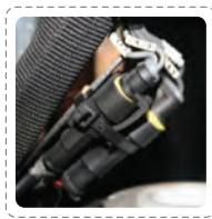
>> 一体式微动开关的设计