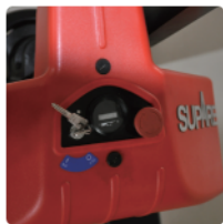
>> 急停按钮安全系数高